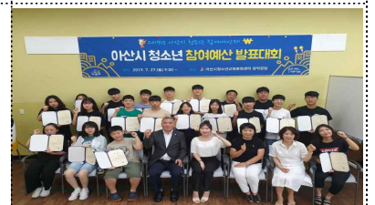
청소년 참여예산제 운영