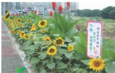
온양1동 해바라기 꽃길