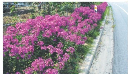
송악면 39호 국도변 푸록스 꽃길