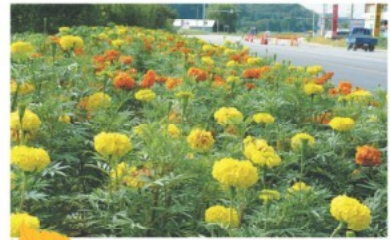
음봉면 동천리 메리골드 꽃길