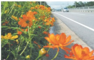
둔포면 국도 45호 봉재 저수지변 황색코스모스 꽃길