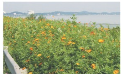
인주면 아산만 방조제 황색코스모스 꽃길