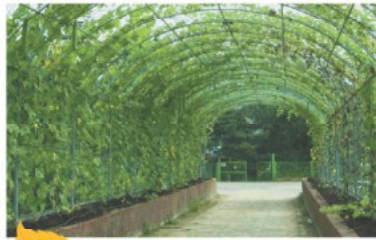
탕정면 신흥교 조롱박 수세미 터널