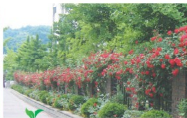
온양2동 삼정APT 넝쿨장미