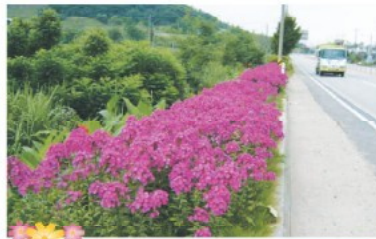
도고면 21호 국도변 푸록스 꽃길