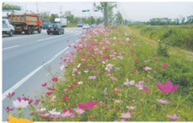
배방면 21호 국도변 코스모스 꽃길