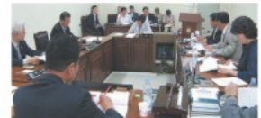
▲ 2007년도 제2회 추가경정 예산안 심사중 인 총무복지위원회 의원들