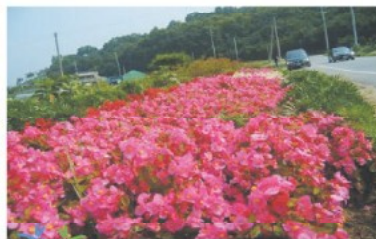
온양5동 초사동 소공원 꽃화단