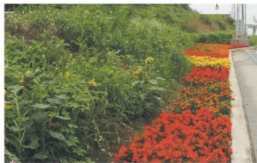
영인면 진입로 베고니아 꽃길