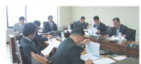
▲ 2007년도 제2회 추가경정 예산안 심사중 인 산업건설위원회 의원들

법」이 시행됨에 따라 법령에서 조례로 위임한 사항을 조례로 규정하여 우리시 실정에 맞게 시행하고자 제정함