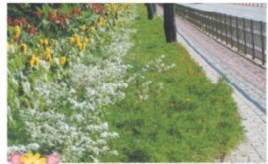
신창면 21호 국도변 꽃화단