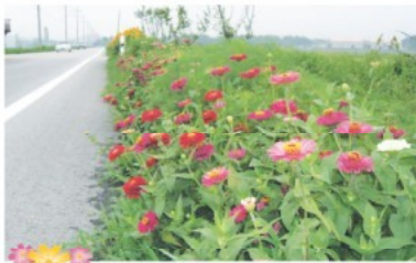
선장면 가산리 백일홍 꽃길