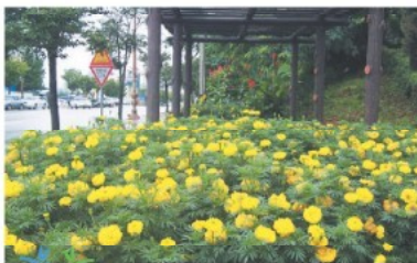
온양4동 실내체육관 앞 메리골드 화단