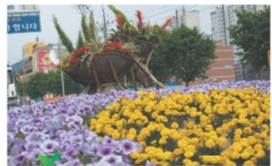
온양3동 교통섬 꽃화단