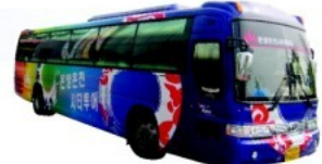
▲ 시티투어 운행 버스

것으로 기대되는 아산시티투어는 제1코스(영인산휴양림-아산온천-현충사-민속박물관)와 제2코스(민속박물관-현충사-외암민속마을-신정호)로 나누어 매주 토, 일요일 5회에 걸쳐 순회 운영하며 성인 6,000원, 어린이 및 경로우대자 4,000원으로 저렴하게 운영할 방침이다.