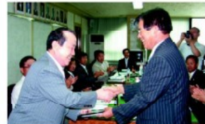
▲ 이진구 국회의원에 표창패를 전달하고 악수를 나누고 있다.

이번 의원회의에서는 도시환경정비구역 지정관련 특위구성 요청과 공설 낚물당 설립과 관련 특위구성 주민요청에 따른 민원서류에 대하여 소관위원회별로 현장답사와 주민의견수렴을 통한 심도 있는 조사를 실시하고 27일 의원회의를 통하여 특위 구성에 따른 안건을 최종 협의하기로 결정하였다. 또한 제5대 아산시의회 개원 1주년을 맞이하여 제17대 국회의원으로 재임하면서 지역균형 발전과 우리시 주민 숙원사업에 헌신 노력하고 정부예산확보에 공헌을 다