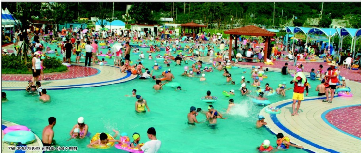
7월 20일 개장한 신정호 야외수영장