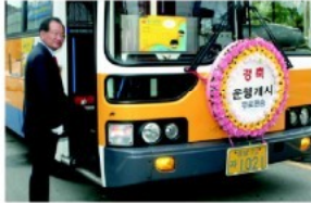
▲ 시티투어 시내버스 무료 환승식

온양온천의 옛명성을 되찾고 관광도시 아산의 활성화를 위해 다양한 아이디어를 발굴하고 있는 아산시가 시내버스무료환