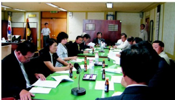
▲ 특위구성 요청 건에 대하여 의견을 협의하고 있다.

아산시의회의회장이기원은 2007년 7월 16일 오전10시30분에 이장실에서 2007년도 제6회 의원회의를 개최하였다.