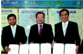
▲ 시티투어 협약식

온양온천의 옛명성을 되찾고 관광도시 아산의 활성화를 위해 다양한 아이디어를 발굴하고 있는 아산시가 시내버스무료환