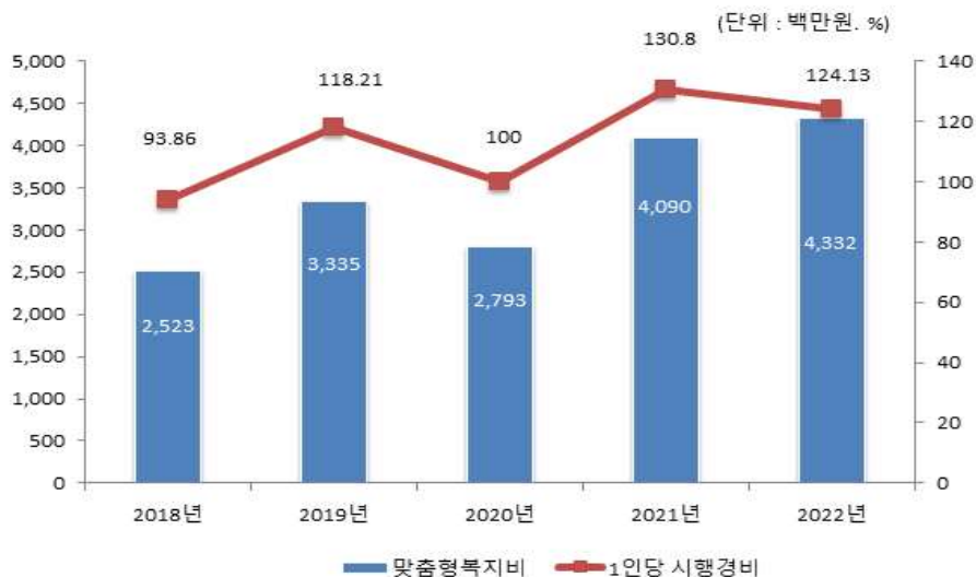
맞춤형복지제도 시행경비 연도별 추이