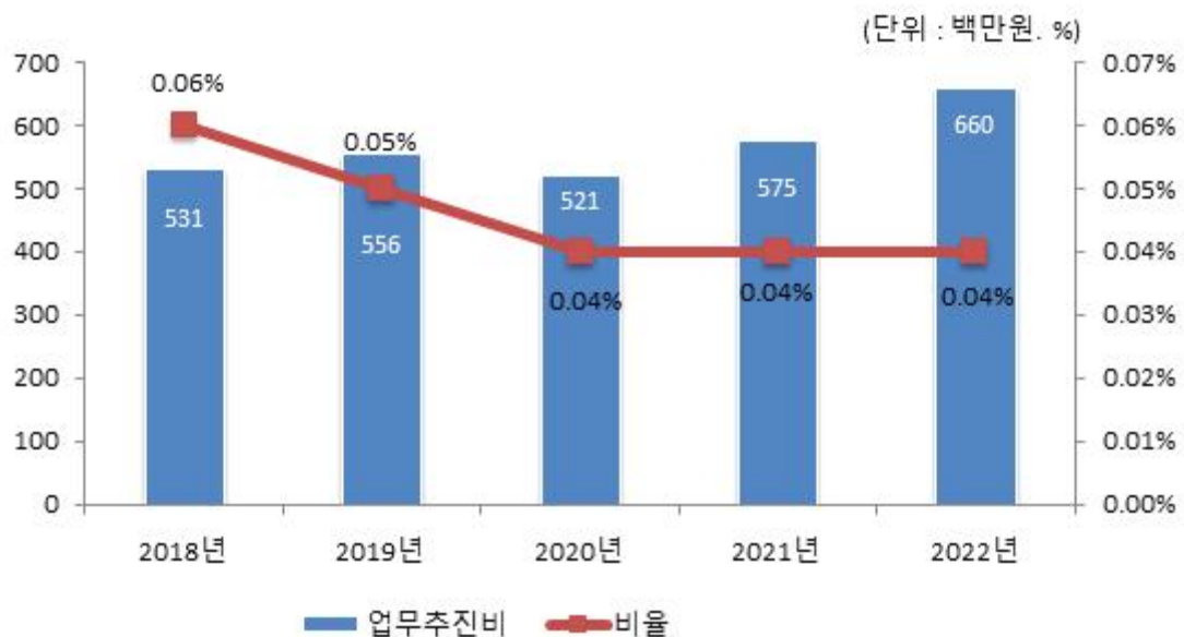
업무추진비 연도별 변화

☞ 업무추진비는 기준 한도액에서 편성·운영하고 있으며 세출결산액 증가 대비 업무추진비가 차지하는 비율은 2020년부터 감소 추세에 있습니다.