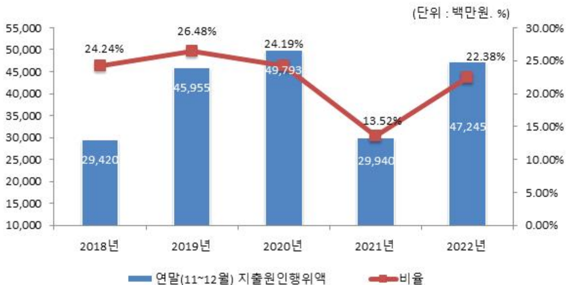
연말지출비율 연도별 변화